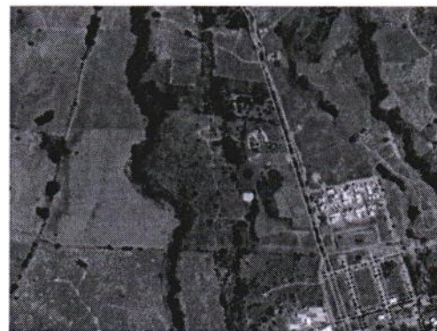
CROQUIS MICRO LOCALIZACIÓN

"2025, Año del Bicentenario de Manzanillo como Puerto de Cabotaje y Altura"